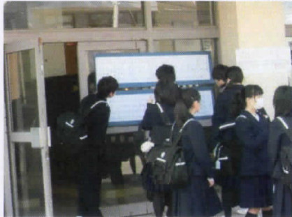
クラス編制の張出し表を見る生徒の様子

4月7日(月)に、第1学期の始業式が行われ、平成26年度の赤塚中が、生徒391名、職員39名の新体制でスタートしました。 「未来社会を生きることのできる、確かな学力・豊かな心・健やかな体を持った生徒の育成」に向けて、～「文武不岐」を目指す～をスローガンに生徒の力を存分に引き出せるよう頑張りたいと思います。 保護者の皆様や地域の皆様のご支援とご協力をよろしくお願いいたします。