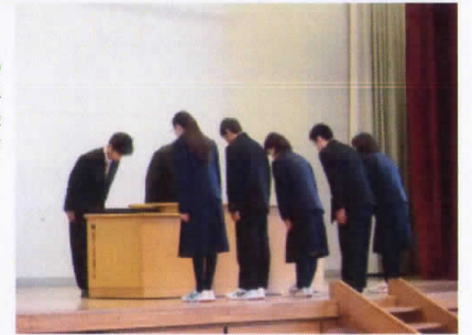
前期生徒会役員任命