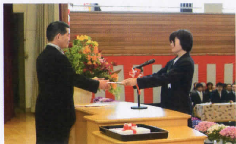
新入生「誓いの言葉」

「東武館」では、「勉強します」、「剣道します」、「良い行いをします」を三つの誓いとして、この精神を受け継いでいます。