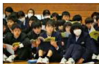
熱心に聴く参加生徒