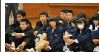
自分たちが主権者