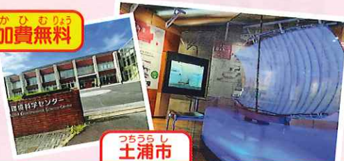
土浦市 茨城県霞ヶ浦環境科学センター