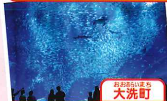
大洗町 アqualワールド