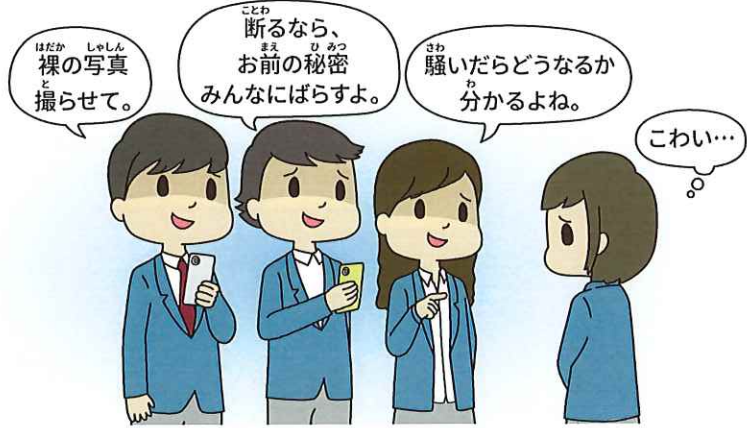
裸の写真が撮られてしまった…