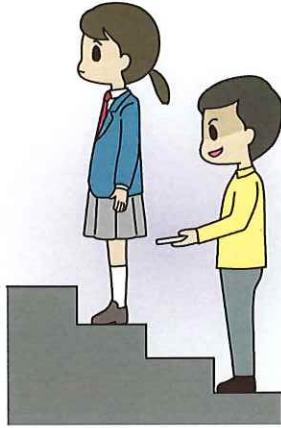
下着を盗撮された…