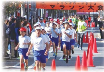
(R元) ハミングロードマラソン大会