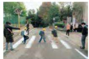
ふれあいプラン「あいさつ運動」