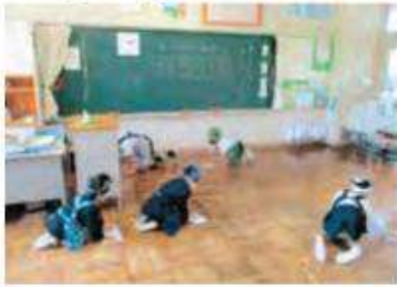
すみずみ清掃・まごころ清掃