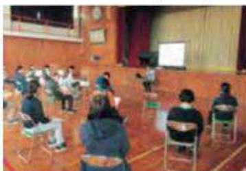
小中合同カウンセリング研修会