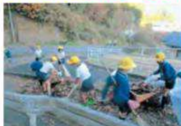
清潔なまちづくり運動(小中合同)