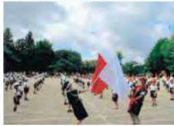
小学校運動会・中学校体育祭