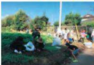
小中合同PTA奉仕作業