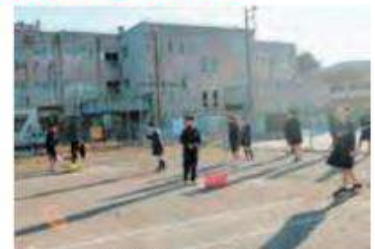
小学生部活動体験