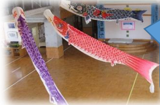
1階エントランスを鯉のぼりが泳いでいます。

算数の「少人数指導」や「習熟度学習」は、本校の特色ある教育活動の一つです。本校には算数専科指導教員が配置されており、算数の学力向上に特に力を入れています。