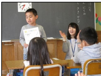
1年生は、自己紹介カードの発表を行いました。

その中の一つとして、「元気にあいさつをする」ことを指導しています。「おはようございます」「こんにちは」「さようなら」の声でいっぱいになると素晴らしいと思ひます。