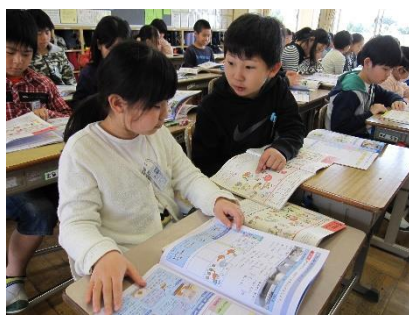
5年生は、家庭科で家族の役割についてペアで考えました。