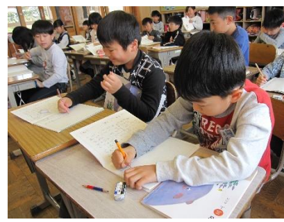
3年生は、国語で教材「きつづきの商売」を学習しています。