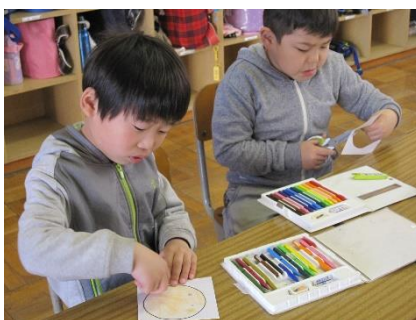
2年生は、国語の発表で使う自分の役割カードを作りました。