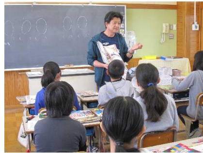
6年生の社会は教頭先生が担当しています。

算数の「少人数指導」や「習熟度学習」は、本校の特色ある教育活動の一つです。本校には算数専科指導教員が配置されており、算数の学力向上に特に力を入れています。