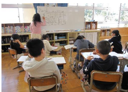
4年生は、学級を3グループに分けた習熟度的学習を行っています。