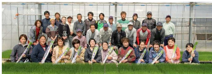
～JA水戸・水戸地区のねぎ生産部会の皆さん～