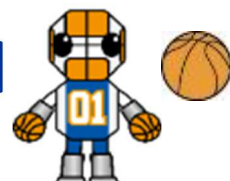
マルコットキャラクター ロボスケ