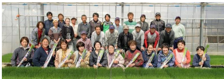
～JA水戸・水戸地区のねぎ生産部会の皆さん～