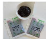
みとちゃん ブルーベリージャム