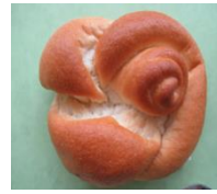
みとちゃん米パン

児童生徒の地場農産物への興味・関心や産業等への理解を深め、生産者や食材への感謝の気持ちを育むなど、学校給食を通じて食育の推進を図っています。