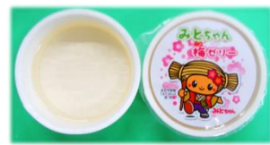
みとちゃん梅ゼリー 他