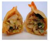
みとちゃんぎょうざ