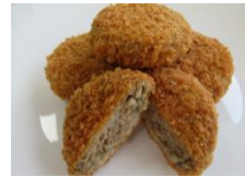
みとちゃん ごぼうメンチカツ