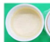
みとちゃん梅ゼリー