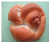
みとちゃん米パン