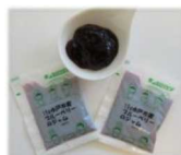
みとちゃん ブルーベリージャム