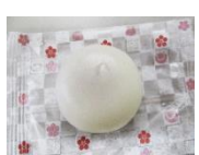
みとちゃん団子 他