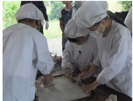
ピザの生地を伸ばします