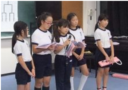
楽しみにしていたキャンドル・ファイヤー