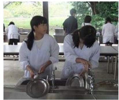
後片付けも協力して