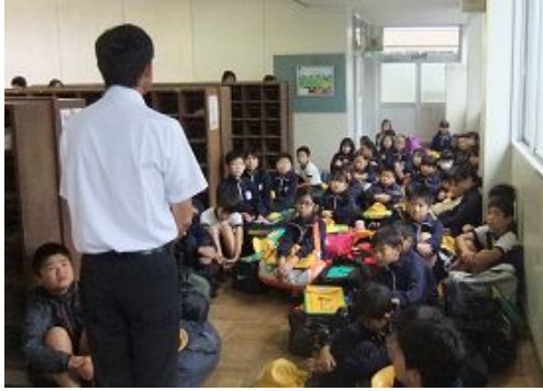
出発式は雨天のため昇降口の中で