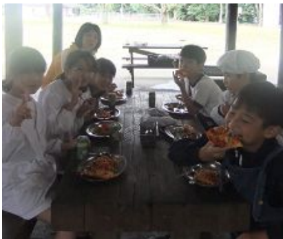
おいしいピザとスパゲッティのできあがり!