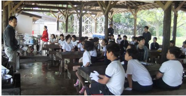
2日目の活動のメインはピザ・パスタづくり