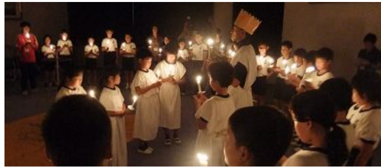
火の神のことば「なかまと自分をよく見つめましょう」