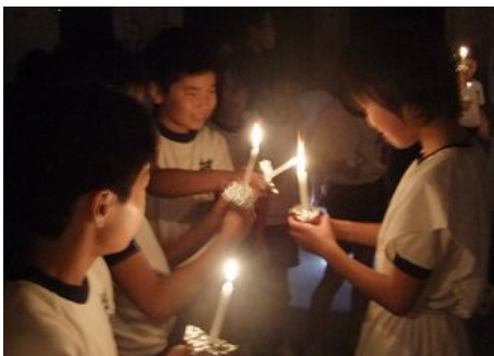
分火…全員のろうそくに火が