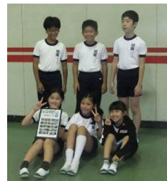
2組もひと班紹介 （無作為です）