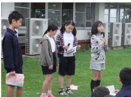
2日目は雨が上がり屋外で朝のつどいできました