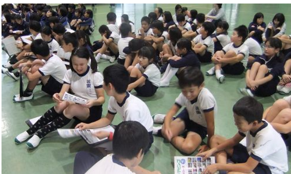
雨天でウォークラリーができなかったため 屋内で「インドアビンゴ」を行いました