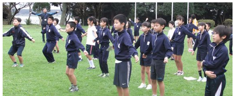
元気にラジオ体操