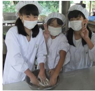
生地をこねます … オリーブ油を加えて