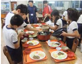
みんなで協力して夕食