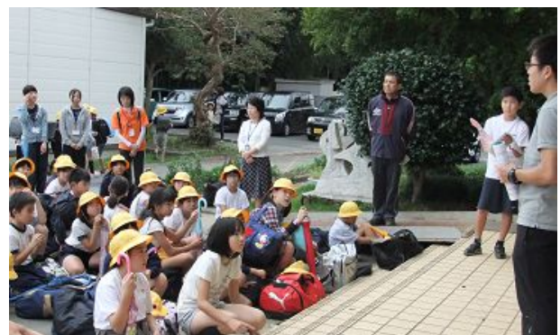
無事学校に帰ってきました