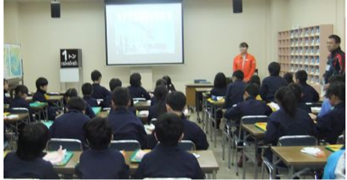
まず鹿島製鉄所の見学（説明を聞きました）