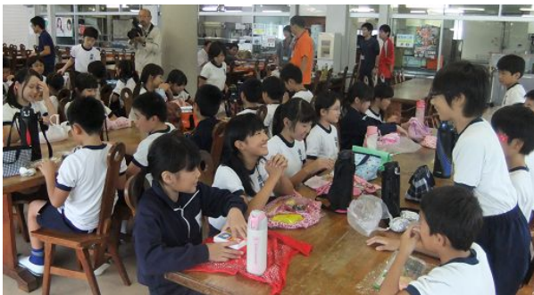
白浜少年自然の家に着き、まずお弁当（雨天のため屋内で）