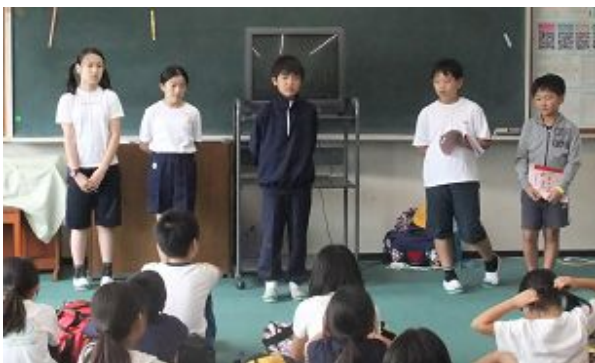
退所式 宿舎の皆さまに大変お世話になりました