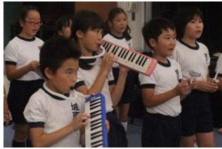
歌の伴奏も自分たちで