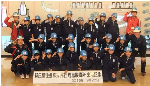
ヘルメットをかぶって記念撮影 1組