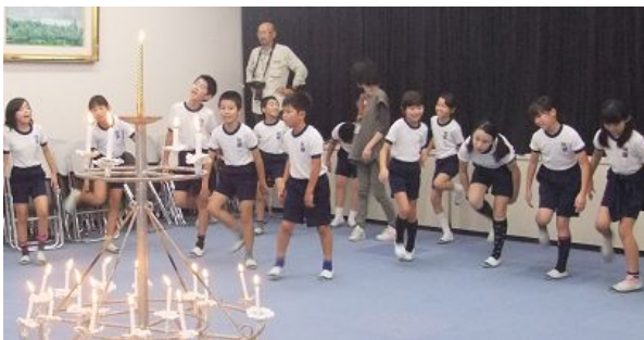
楽しくフォークダンスとゲーム