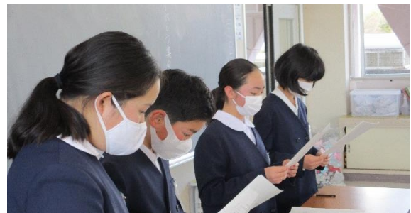
< ありがとう集会の進行の練習をする様子 >