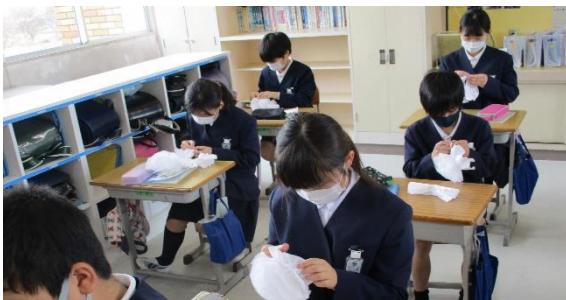
< 6年生の教室の飾り付けの花を折る様子 >

今、5年生はお世話になった6年生のために3月8日に行われる「ありがとう集会」の準備をがんばっています。5年生全員が実行委員・応援団・掲示物係・プレゼント係のいずれかに所属し、短い準備期間の中で精一杯活動に取り組んでいます。また、代表委員や新通学班の班長・副班長など6年生卒業後の最高学年として活躍します。これらの活動を通して最高学年としての自覚や責任感が深まり、6年生としてのスタートが順調に切れることと思います。