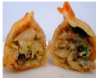
みとちゃん餃子 (水戸市産ねぎ・ キャベツ・にら・ 米粉・豚肉)