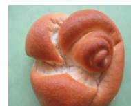
みとちゃん米パン (水戸市産米粉)