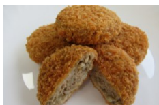
みとちゃんごぼう メンチカツ (水戸市産ごぼう)