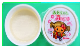
みとちゃん梅ゼリー (水戸の梅ふくゆい)