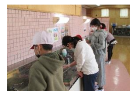
感謝の気持ちで奉仕作業

○ 社会科では、日本と関わりが深い国の人々の生活を調べ、オクリンクにまとめることができました。多様な文化があり、お互いの文化を尊重していくことが大切だということを理解しました。道徳では、自分の考えをもち、友達と意見を交流することで、多面的・多角的な考えができるようになってきました。