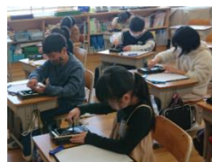
初めて墨をすりました

○ 算数科の学習では、図や口を使った式をもとに、かけ算を使うかわり算を使うかを考えて式を立てることを学びました。体育科の跳び箱の学習では、みんなで協力して準備や片付けをしたり、より高い段や新しい技に挑戦したりする姿が見られました。