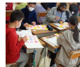
送る会の準備に一生懸命

○ 算数科の学習では、多角形の頂点、面、辺の数について学習し、特徴を捉えることができました。社会科では、日本の災害や自然環境について自分の体験や知識をもとに考えるなど、防災についての理解を深めました。オンライン学習中には、1人1人が毎日目標をもって取り組み、学習後には自分なりに振り返ったことを文章にまとめることができました。