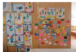
オンライン学習の成果

○ 国語科では、場面の様子や登場人物の気持ちを考えながら、物語文を読むことができました。算数科の「かけ算のきまり」では、九九の表を見て、かける数が1増えると答えがかけられる数の分増える仕組みに気付くことができました。