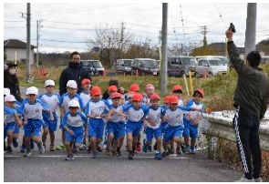
持久走大会のスタートです。 みんな真剣な表情です。 力の限り走り抜けました。