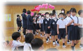
《花のアーチをくぐって入場》

寿小学校のみなさんが「助け合って ありがとうの笑顔つなぎ さらに素敵な寿小学校となる」ことを願っております。