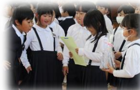
《プレゼントに見入る1年生》