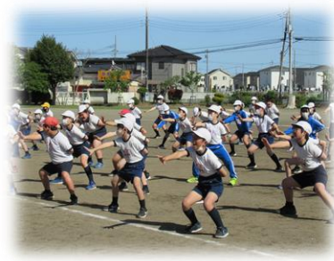
《運動会の練習 6年生》

今年度の運動会は、全学年での開催です。先日は、PTA 本部役員の方のご協力で、当日の場所取りのくじ引きを行いました。全学年開催を知っている教職員ばかりではありません。もちろん、4年生以下は初めての全学年開催です。まだ、手探りのところもありますが、安全に、全力を出す楽しさと、応援することの心地よさを感じながら、よい思い出をつくりたいと考えております。これからスローガンが決まり、プログラムができてくるのが楽しみです。