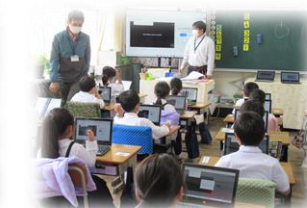
《初めてのタブレット》