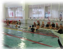
《水泳学習 in ダンロップ》