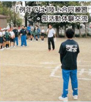
「例年では」陸上合同練習会・部活動体験交流

9月には「見川中学校陸上部と小学生の合同練習会」があります。11月には、見川中学校に見川小学校・梅が丘小学校の6年生とその保護者の方をお迎えして、授業参観と部活動説明会を行います。