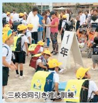
三校合同引き渡し訓練

2学期初めに見川小学校・梅が丘小学校と時刻を合わせて、「三校合同引き渡し訓練」を行います。いつ起きるかわからない自然災害に対し、小学校と中学校が連携を図り、スムーズに下校できるための訓練です。