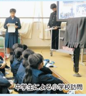
中学生による小学校訪問

2月には、小学6年生が安心して中学校へ進学できるように、中学1年生の先輩から中学校生活についてのお話を聞く「ようこそ先輩」が開催されます。見川中学校の生徒会役員が見川小学校と梅が丘小学校を訪問します。