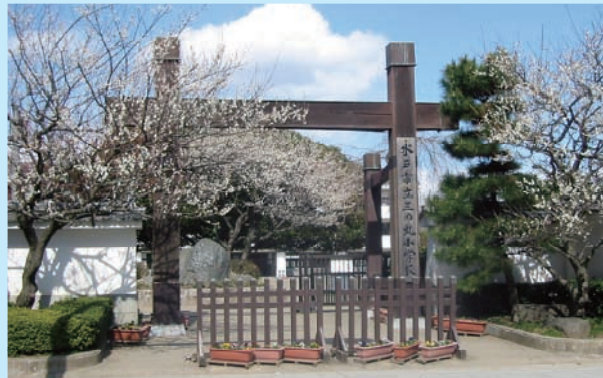
かぶ き もん 【冠木門】