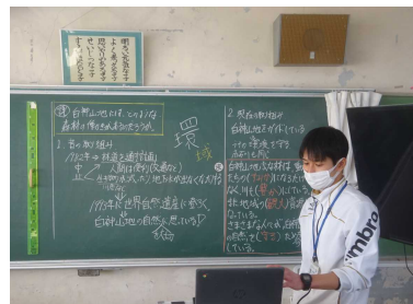
板書を映して説明しています