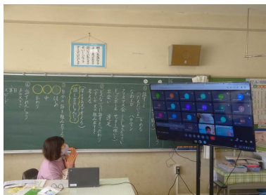
感想を発表中です

また、画面を通して笑顔がたくさん見られます。担任や友達とのやりとりを楽しんでいる様子もうかがえます。引き続きご協力をお願いいたします。