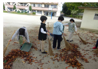
引き継がれる「ちょボラ」