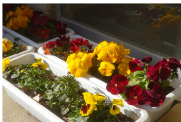
プランターの花も大きくなってきました