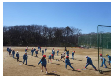
青空の下で体育の授業