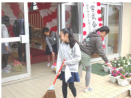
朝、一生懸命準備をする6年生