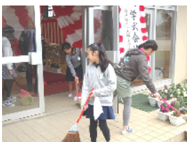
朝、一生懸命準備をする6年生