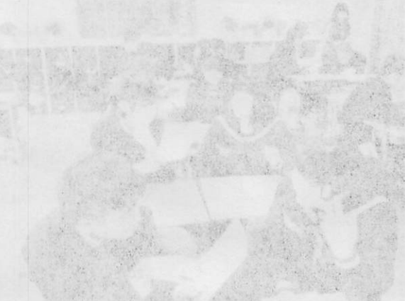
（左側）新産産の現場、右側）新産産の現場

【二層間】、先般は本邦英語の習文を、 徹底して、本邦製品のコスツを削減し、 品質向上を図ります。