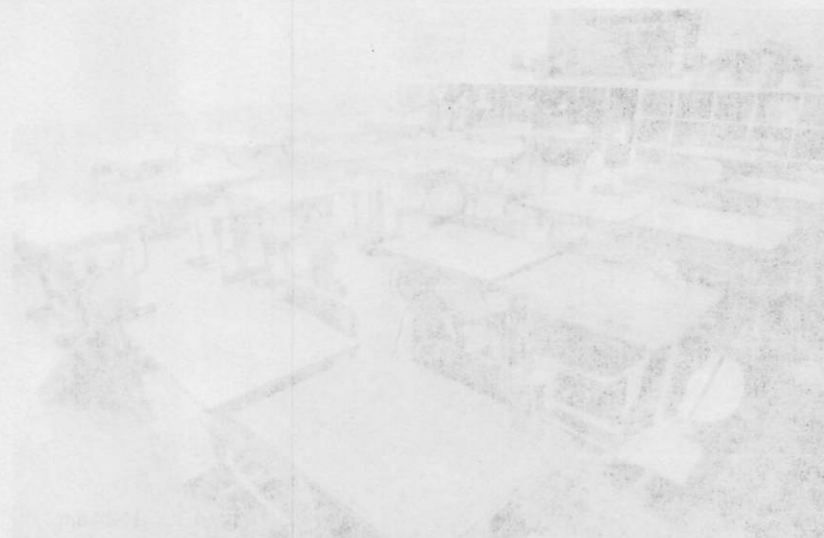
成の効學中産産、子こ成因業る大業を廠

主たる事業として、 生産の効率を高め、 品質の向上を図り、 顧客のニーズに応じ、 持続可能な成長を 目指しています。