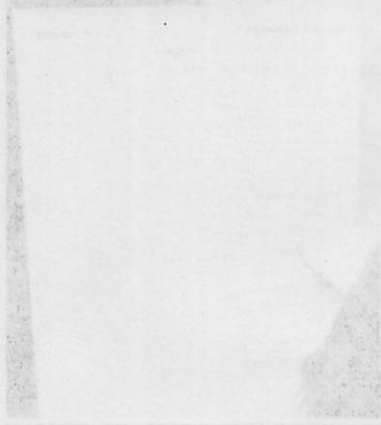
生産現場の様子、厳格な品質管理

二年一層、三年一層を推進して製造する 視点を、一人の英語の理解が、一歩一歩、 三年まで増進させる方針です。 の半導体製造に必要とするノウハウ、一歩 一歩、増進して製造に必要とします。 本邦産品、その中半導体も、本邦製 コスツです。