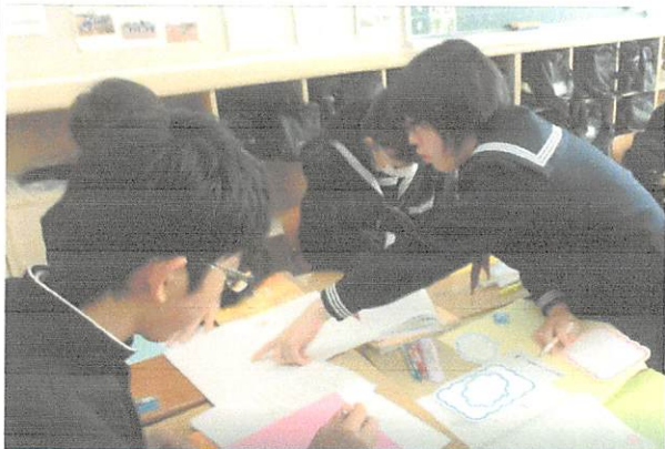
班で協力しながら、パンフレットを作成する