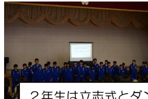
2年生は立志式とダンス発表を実施

2月21日（金）、学年末授業参観及び懇談会を実施いたしました。ご多忙の中、多くの保護者の皆様にご参加いただくことができました。心より感謝いたします。この一年間の子どもたちの成長の手応えが感じられたでしょうか。懇談会でいただいたご意見や感想も参考にして今後の教育活動を充実させていきたいと思っております。今後ともどうぞよろしくお願いいたします。