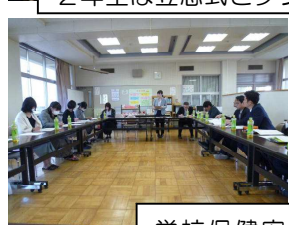
学校保健安全委員会

また、同日「第3回学校保健安全委員会」を開催いたしました。本校の生徒の健康状況や体力テストの状況、自転車による登下校の状況、各学年の保健安全面での成果と課題などを委員の皆様と共有できました。ご家庭のご理解とご協力を得ながら、一人ひとりの生徒の健康体力の増進、安全な生活の確保に努めていきたいです。