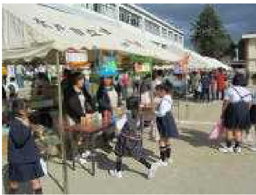
↑ おにぎりと予約券を交換する児童

平成24年10月27日(土)に吉田小まつりが開催された。TA会画準備運してはるに。天ど室企つな高の遊りゴルしち参加り、き、室が行わ乳バもザ