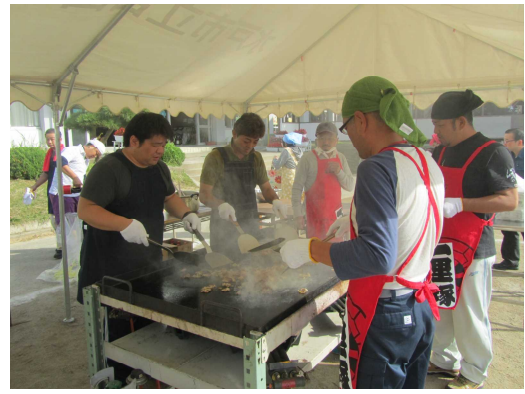
↑ ファーザーズによる焼きそば作り