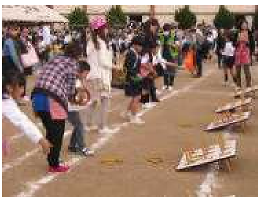
↑ 輪投げを楽しむ児童