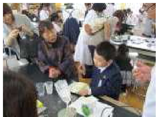
↑ おもしろ理科教室(電気パン作り)

屋外のテントでは、豚汁、焼きそば、おにぎり、和菓子、ヨーヨー釣、飲み物、バザーなどのコーナーが、体育館ではゴム射的、フェイスマンティンク、喫茶店、おもしろ理科教室(電気パン作り)など、体験コーナーが設けられていました。おもしろ理科教室では、電気を使って、牛乳パックで蒸しパンを作りました。保護者や地域の皆様方の協力のおかげと感謝しています。バザーの収益金は、子どもたちの教育活動のために活用させていただきます。