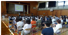
(6年性教育講演会の様子)

☆7月1日(金) わくわく学習会 第1学期末授業公開、懇談会にはご多用の折、多数の保護者の皆様にご来校いただきありがとうございます。夏休み2学期へ向けて、さらによりよい教育活動が展開できるよう尽力いたします。今後ともご支援よろしく願いいたします。