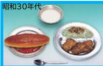
昭和30年代 当時豚肉より安価な、クジラ肉がよく登場していました。