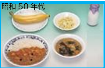
昭和50年代 昭和54年水戸市で米飯給食開始されました。