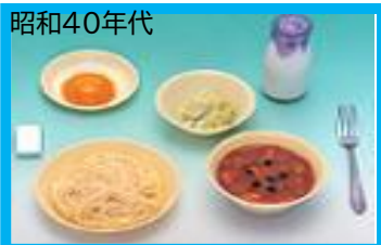
昭和40年代 水戸市では脱脂粉乳から牛乳になりました。