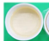
みとちゃん梅ゼリー