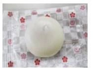
みとちゃん団子 他