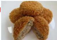
みとちゃんポークロケット みとちゃんごぼうメンチカツ