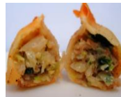
みとちゃんぎょうざ