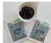
みとちゃん ブルーベリージャム