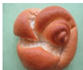
みとちゃん米パン