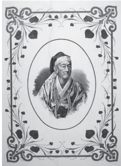
9代石岡藩主・松平頼綱肖像画(明治中～後期、個人蔵)

子爵・府中松平家に生まれた頼則。激変する時代に翻弄されながらも、従来の価値観にとらわれない、新しい生き方を模索してゆく。