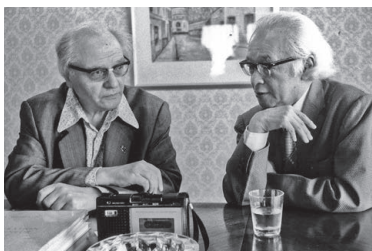
オリヴィエ・メシアン(左)との対談(1978年、個人蔵)

「世界の巨匠」となった頼則だが、歩みを止めることはなかった。まるで求道者のように独自の音楽を追求しつづけた、果てなき挑戦の軌跡を見てゆく。