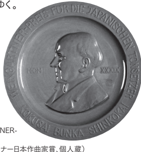
WEINGARTNER-Preis 1939 (ワインガルトナー日本作曲家賞、個人蔵)

「斜陽華族のはしり」ともいえる逆境の中で、頼則は音楽の道へと進む。20世紀生まれの作曲家たちと共に、若き情熱で時代をつき動かしてゆく。