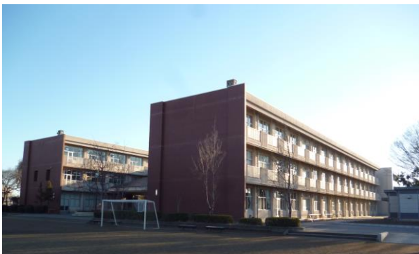
朝日に輝く吉沢小学校

笑顔、感動のある吉沢小学校を今後も目指し続けます。保護者の皆様、ご理解ご協力をよろしくお願いいたします