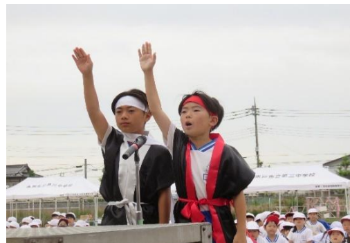
応援団長の選手宣誓

動会でもすばらしい応援を披露しました。6年生にとっては、最後の運動会。「赤組、白組全員で協力し、最高の応援合戦をしたい」と意気込み、朝の活動や休み時間も、自主的に集まり、話し合いや練習を重ねてきました。学校の中心である6年生の団結、やる気が、他の児童にも伝わり、とてもすばらしい運動会になりました。