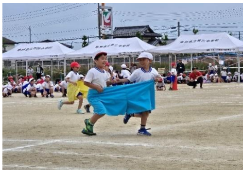
1、2年生デカバンでゴー!

「心をひとつに燃え上がれ」、白組スローガン「仲間を信じて勝利へ進もう」のもと、各色の応援団を中心に一致団結することができました。応援団は、ゴールデンウィーク前から集まって練習し、運