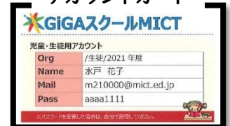
アカウントカード