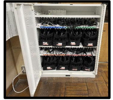
じゅうでんほかんこ 充電保管庫