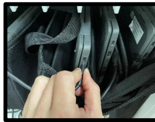
せんたんぶぶん 先端部分を もちましょう。