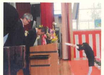
【教科書授与の様子】

新入生のみなさん、保護者の皆様、入学おめでとうございます。校長先生のお話や6年生からの言葉を意識して生活していきましょう。