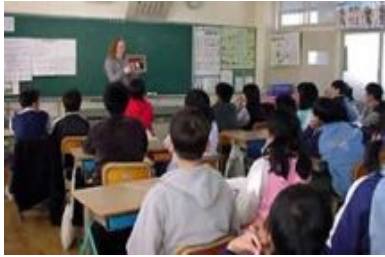
【AETによる英会話の授業】