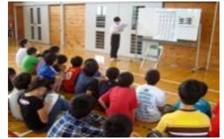
【中学生による母校訪問】