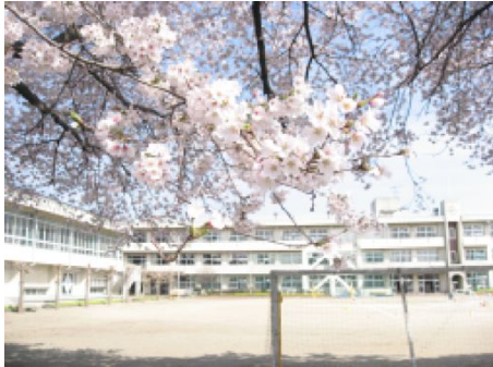
【水戸市立石川小学校】