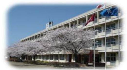
【水戸市立石川中学校】