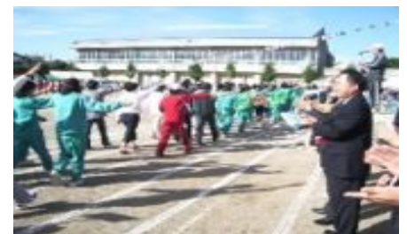
【市民運動会への参加】