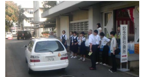
【地域の敬老会のボランティア活動】