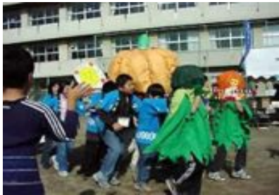
【かぼちゃまつりへの参加】