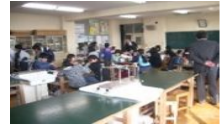
【小学生の中学校での体験授業】