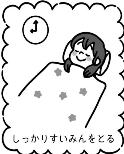
しっかりすいみんをとる