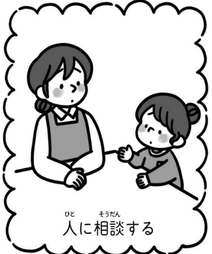
ひと とうだん 人に相談する

4月が始まって新しい学年、新しい担任の先生、よし！がんばるぞ！と気合いを入れていた人も多いでしょう。新生活にも慣れて、そのがんばりに少し疲れが出てくる時期かもしれません。体も心も少し疲れを感じたら、体を休めることを心がけてみましょう。特に夜早めに布団に入ること、よくかんでバランスのよい食事をとることをやってみてください。少しずつ元気がチャージされ、やる気が出てきます。もし、不安なことや困ったことがあって話をしたいときは、保健室に来てくださいね！