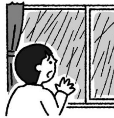
ふようふきゆう がいしゆつ ひか 不要不急の外出は控える