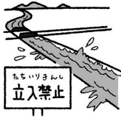
かわ うみ 川や海などに近づかない