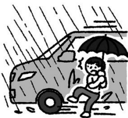
こうつうじこ 交通事故に気をつける