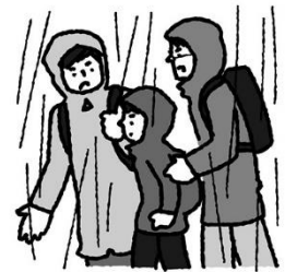
じちたい ひなんしじ したが 自治体の避難指示に従う