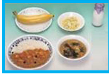
【カレーライス, 牛乳, 塩もみ, 果物, スープ】

パン, ソフトメンに加えてごはんが登場し、栄養バランスが整うようになりました。カレーライスは、今も昔も人気メニューの一つです。