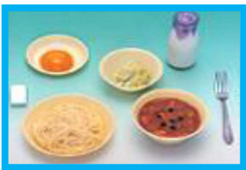
【ソフトメンのカレーあんかけ, 牛乳, 甘酢和え, 果物, チーズ】

学校給食用飲料として、脱脂粉乳から牛乳へと切り替わりはじめました。また、ソフトメンが登場するようになりました。