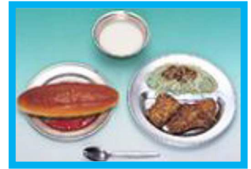
【コッペパン, ジャム, 脱脂粉乳, 鯨肉の竜田揚げ, 千切りキャベツ】

パン, 脱脂粉乳, おかずの完全給食がはじまりました。鯨肉は貴重なたんぱく源として、給食によく登場していました。