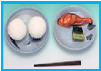
【おにぎり, 塩鮭, 菜の漬物】

山形県の忠愛小学校で、お弁当を持って来ることのできない子どもたちのために、昼食を出したことが始まりと言われています。