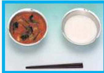
【トマトシチュー, 脱脂粉乳】

戦後の、昭和 21 年 12 月 24 日、外国からの支援物資により給食が再開されました。現在は冬休み中なので、1 カ月後の 1 月 24 日からの 1 週間が「全国学校給食週間」となりました。