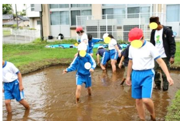
資料3 生き物の観察