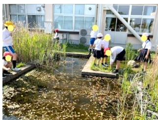
資料4 腐葉土づくり