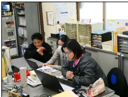
資料2 グループ協議の様子