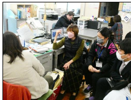
資料3 グループ協議の様子