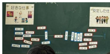
資料8 スケールで可視化

◎生徒と関係が良好で素晴らしい。 ◎受容的な姿勢⇔毅然とした指導、のバランスがきちっとしている。 ◎生徒はワークシートに根拠や理由を添えて自分の考えを書いていた。 ☆道徳の授業を行う際には、内面的な動機づけを大切にしてほしい。 ☆学習形態を工夫すると、もっと多面的・多角的に考え議論する道徳ができるのではないかと。