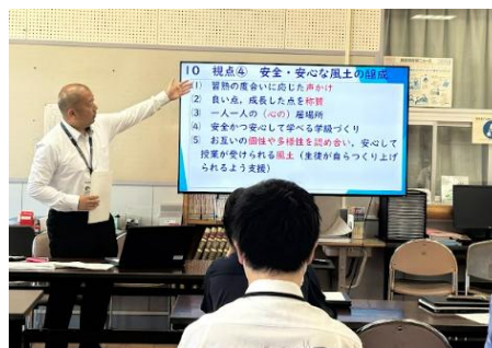
資料2 要請訪問（生徒指導）