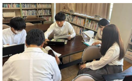
資料5 学年別分析・イメージ共有