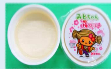
みとちゃん梅ゼリー