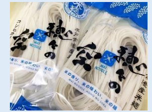
米粉麺・米粉ペンネ ～穂々の空～