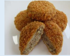
みとちゃんごぼうメンチカツ (水戸市産ごぼう)