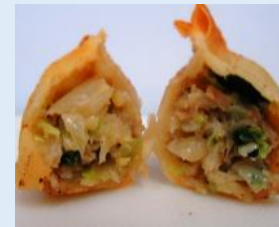
みとちゃんぎょうざ (水戸市産ねぎ・にら・キャベツ・米粉・豚肉)