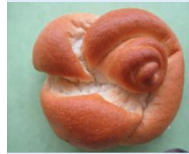
みとちゃん米パン