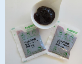
みとちゃんいちごジャム