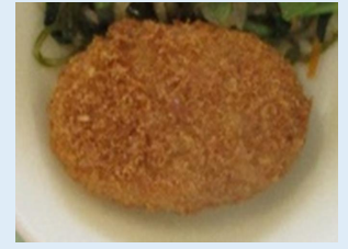
みとちゃんポークコロケ (水戸市産豚肉)