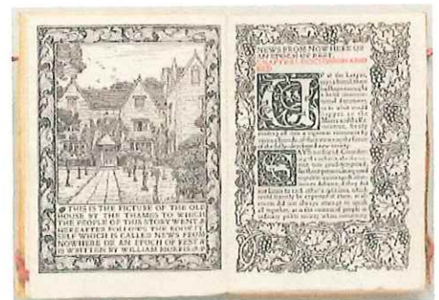
《ユートピア便り》1892年 ウィリアム・モリス