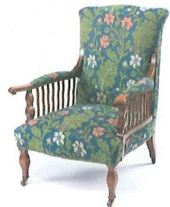
《サーヴィル肘掛け椅子》1890年頃 ジョージ・ワシントン・ジャック