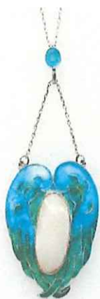
《ホワイトメタルのエナメル・ペンダント》 1920年頃 ジェームズ・クロマー・ワット