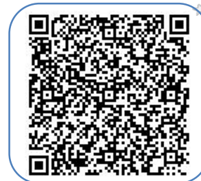
いばらき電子申請・届出サービス QRコード