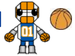
マルコットキャラクター ロボスケ