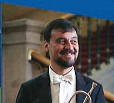
ライナー・キューブルベック (トランベツト)