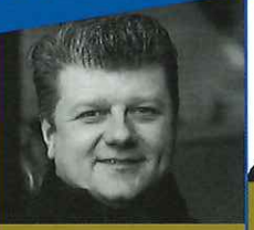
ラデク・バボラーク (ホルン)